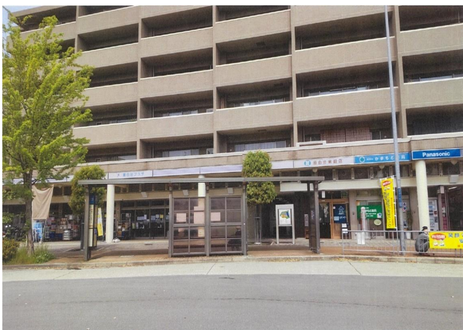
ゆらら藤白台 阪急バス ゆらら藤白台バス停