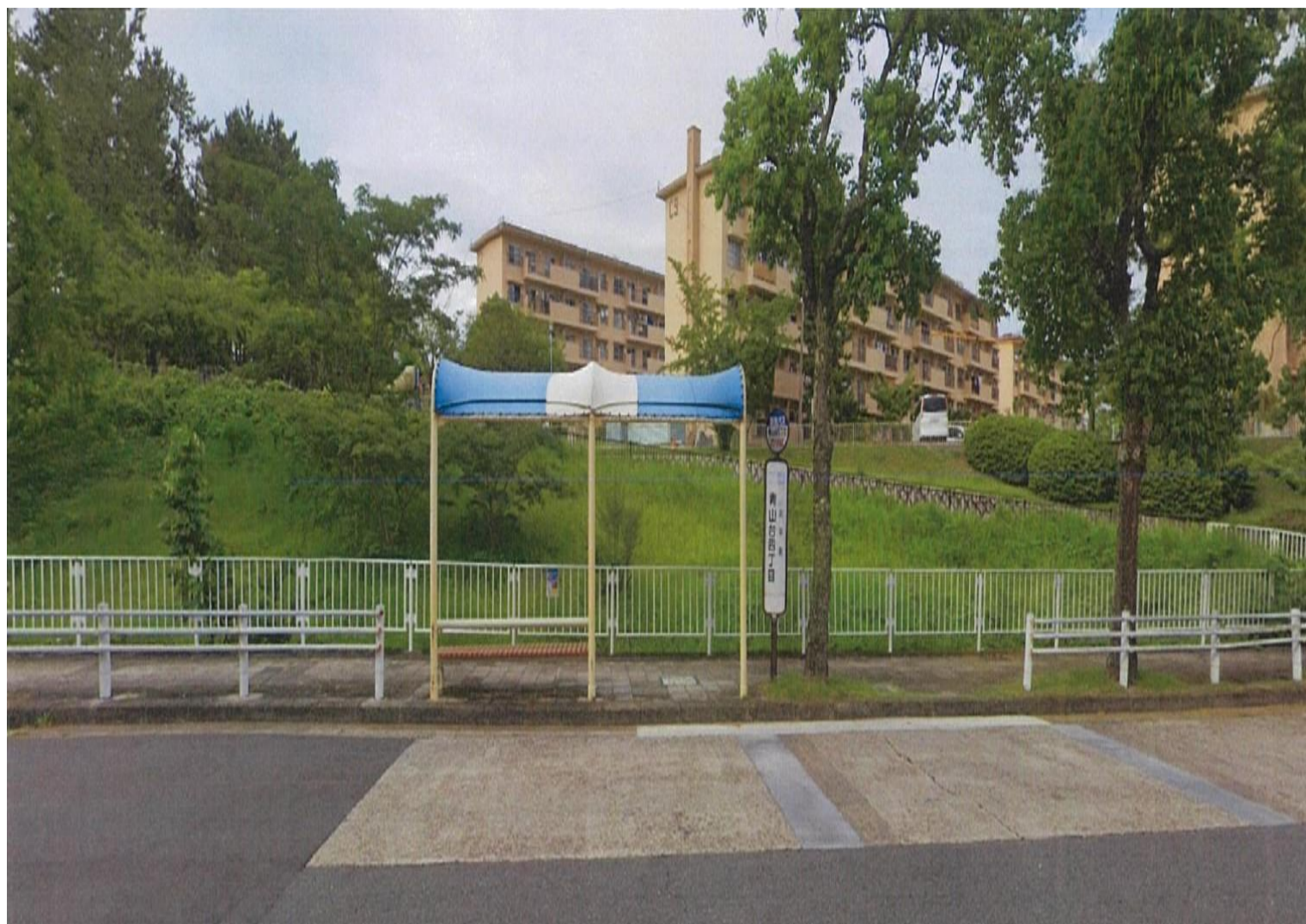
青山台4丁目 阪急バス 青山台4丁目バス停