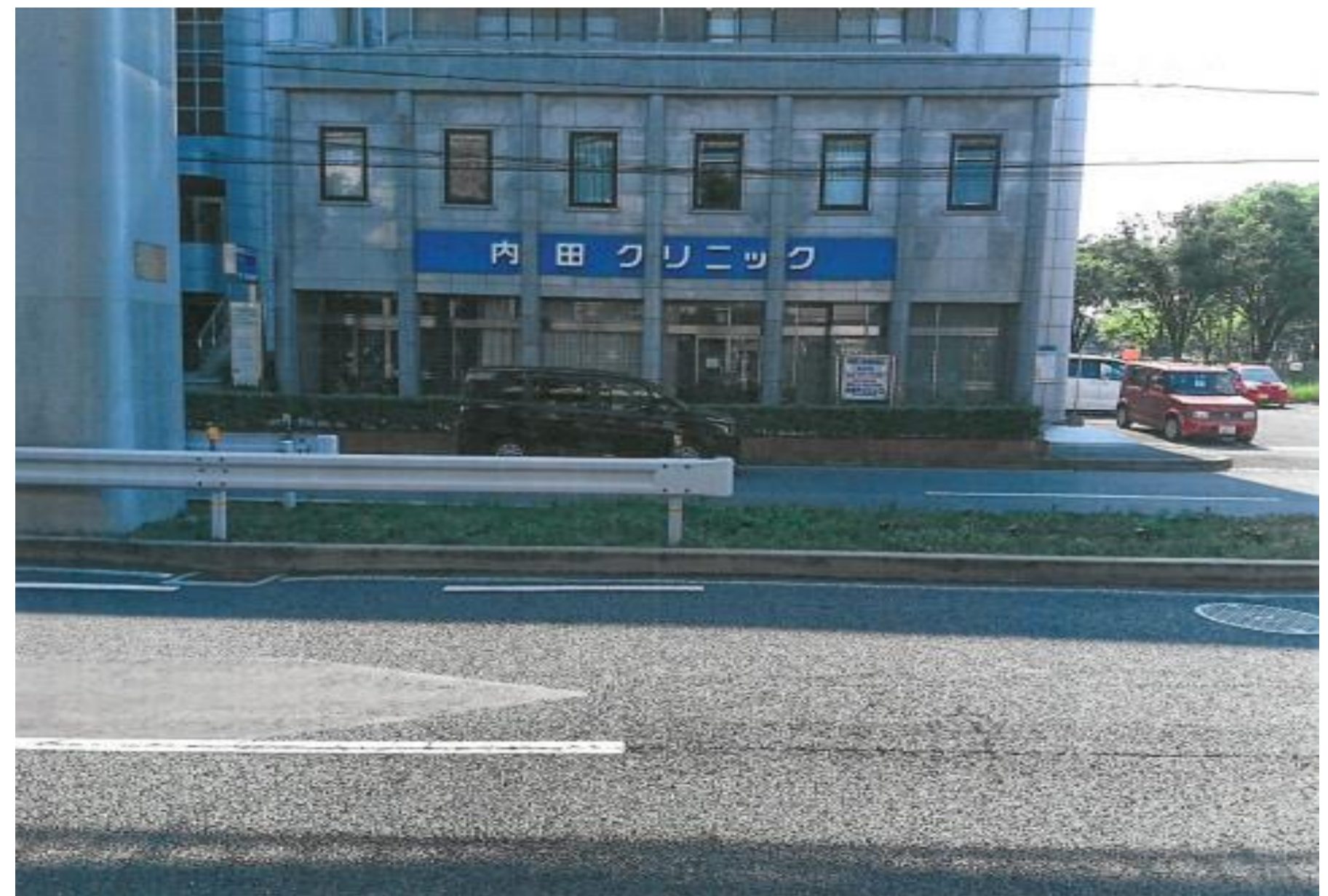
内田クリニック 大阪大学医学部附属病院北側 内田クリニック前