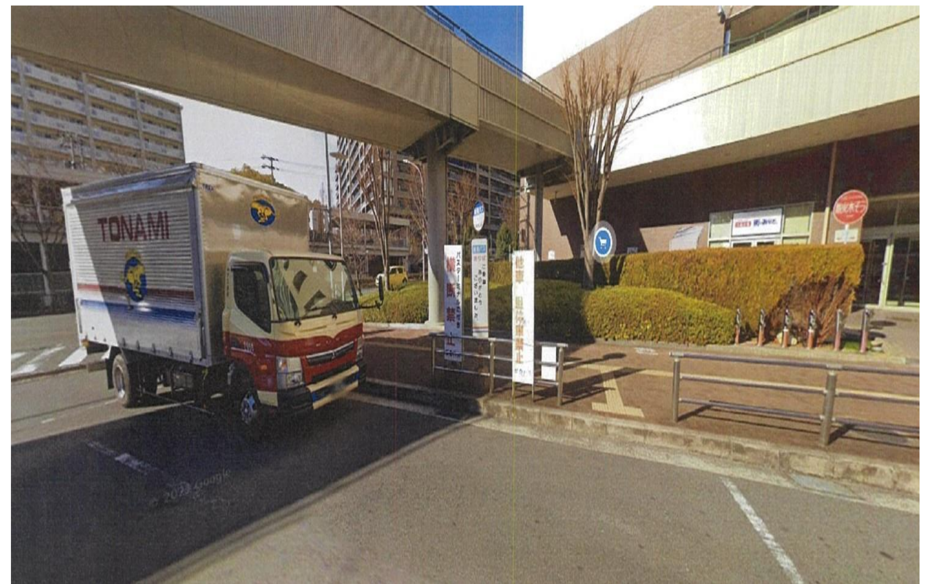
阪急山田駅 歩道橋下付近 商業施設入口側